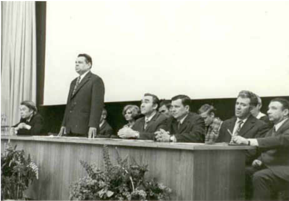
На фотографии: Новосибирск, заседа- ние Пархозактива