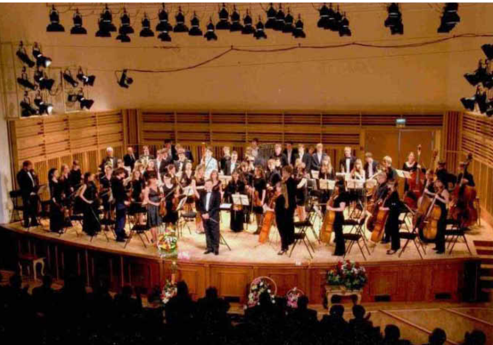
На фотографиях: 25 мая 2012 года. Открытие концертного зала. Новосибирск

был ни вице-губернатором, ни сенатором. Школа влачила жалкое существование в разрушающемся здании на окраине города. Но и тогда в тех стенах выращивали музыкантов мирового уровня, которые стали известны в России и мире.