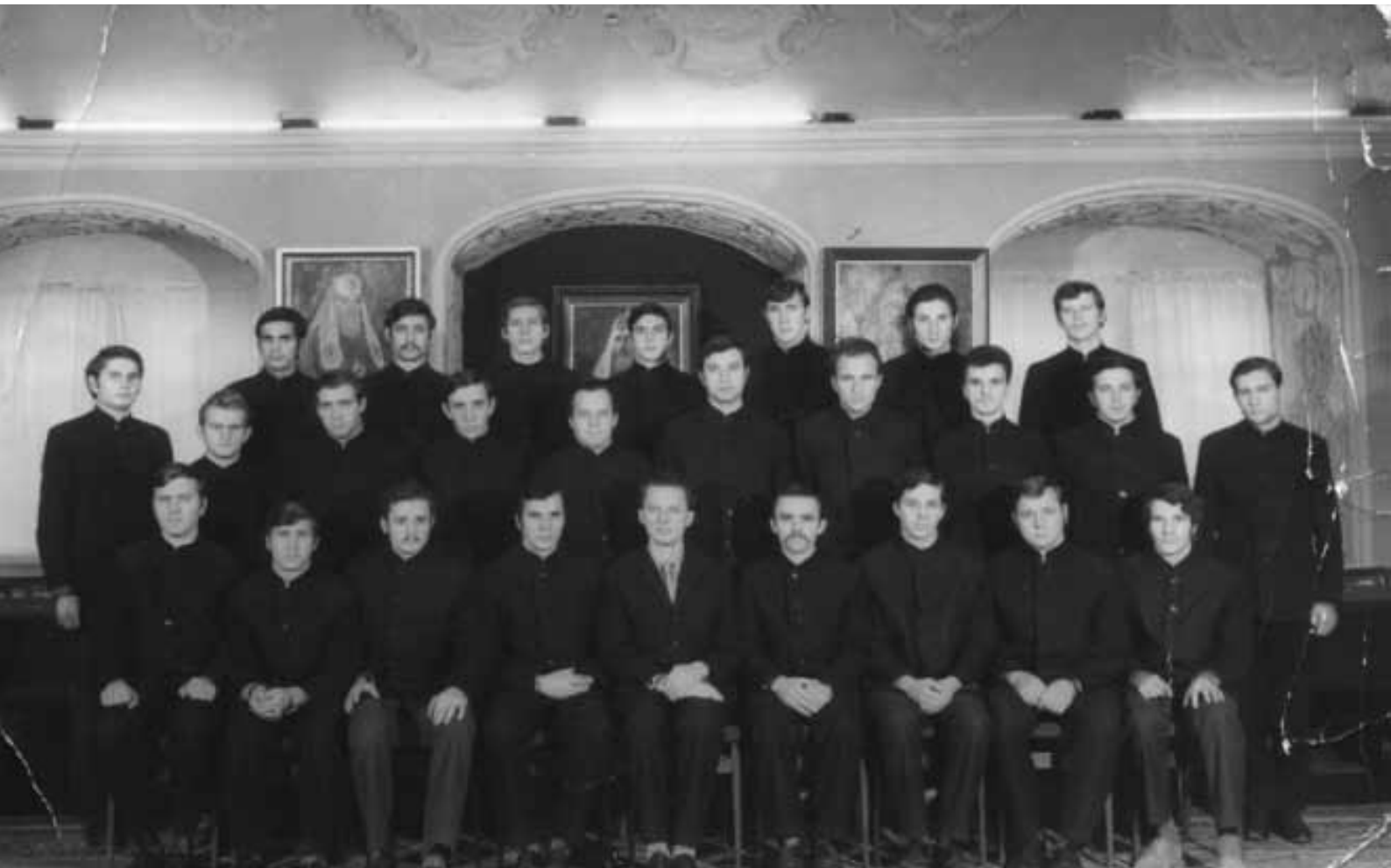
На фотографии: Московская духовная семинария. 1974 год. Воспитанники 1-го класса