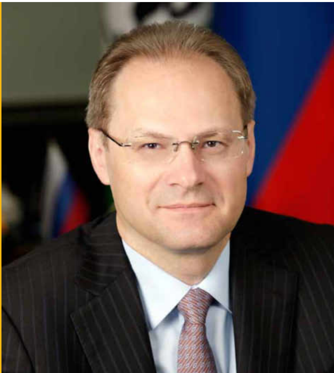
На фотографии: Губернатор Новосибирской области В. А. Юрченко